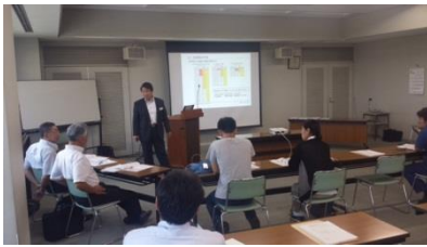
ワークショップのイメージ