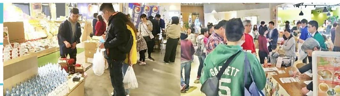
▲ 道産品試食販売会の様子(H30.2 台中)