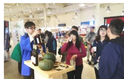
▲台湾販売会の様子(H30)