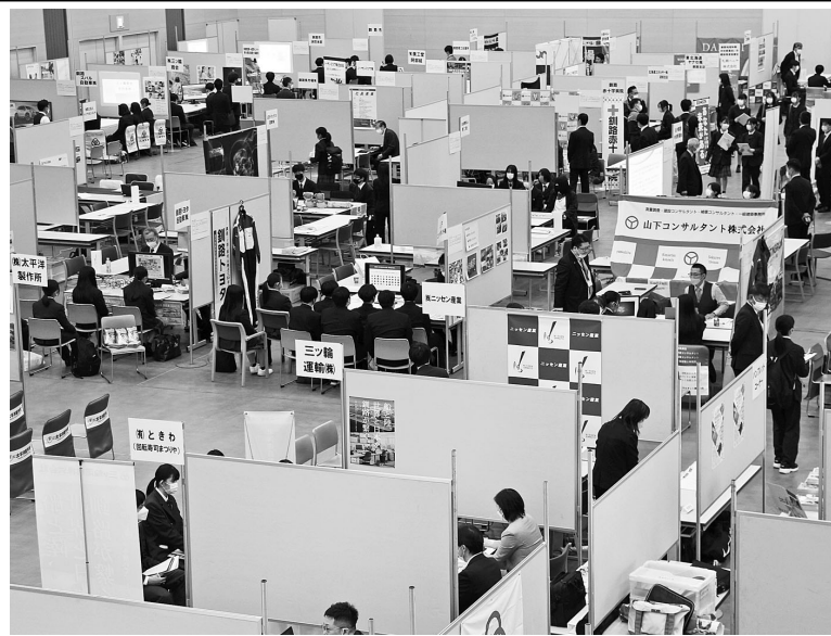
66の企業・団体が出展した合同会社説明会

本補助金は鉦路市内に主たる事業所がある中小企業および小規模事業者が行う新商品・新サービス開発、販売促進、店舗改修、人材確保、設備投資を対象とした採択制の補助金制度で、一般型とチャレンジ型がある。一般型は令和4年度にBizサポ補助金の交付を受けていないことが条件で、補助上限額は30万円(補助率2/3)まで。また、チャレンジ型は令和4年度の本補助金の交付を受けた方のうち、賃上げ・雇用増枠は補助上限額50万円(同3/4)、復活枠に該当する場合、30万円(同2/3)の補助を受け(31)4548まで。 原則、オンラインで申請することになっており、専用フォームから行う。申請に必要な書類は市HPよりダウンロードが可能。先着順で、予算額に到達した時点で受け付けを終了する。鉦路市の担当者は「昨年度も多くの事業者様に活用いただいた。今年度もこの補助金を活用して新たな取り組みにチャレンジしていただき、売上アップや人材確保につなげて欲しい」と活用を呼び掛けている。 本補助金の要件や対象事業など詳細は、市HPから確認できるほか鉦路市産業振興部商業労務課0154(31)4548まで。